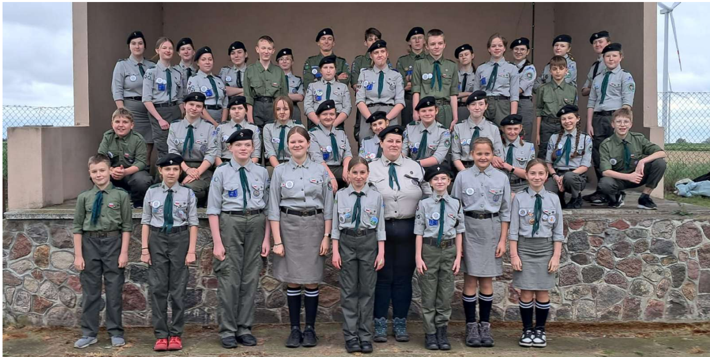
(Kronikarka sam. Daria Wajnert)

Z okazji 10-lecia 19 Wielopoziomowej Drużyny Harcerskiej odbyło się wyjątkowe ognisko, które zgromadziło zarówno obecnych harcerzy, jak i zaproszonych gości. Wspólnie świętowaliśmy dekadę przygód, wyzwani i harcerskiej braterskości. Nie zabrakło wzruszających wspomnień, śpiewów przy akompaniamencie gitary i prawdziwie harcerskiej atmosfery. To był wieczór pełen ciepła, wdzięczności i dumy z naszej drużyny.