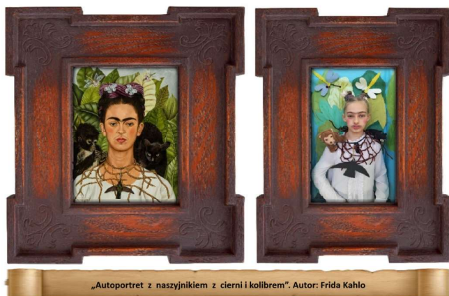
„Autoportret z naszyjnikami z cierni i kolibrem”. Autor: Frida Kahlo