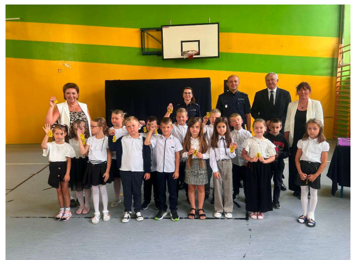
(ZSP w Zimnowodzie)