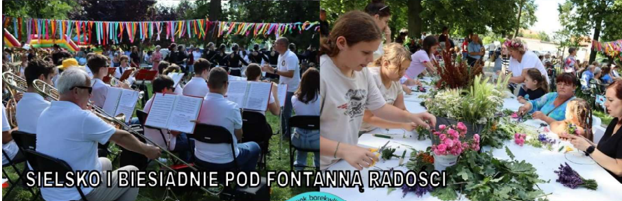
SIELSKO I BIESIADNIE POD FONTANNĄ RADOŚCI