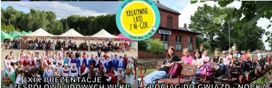
POCIĄG DO GWIAZD - NOGKA