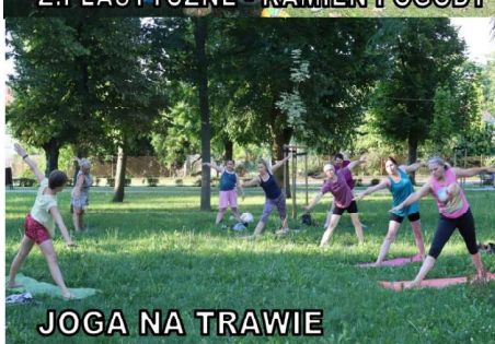
JOGA NA TRAWIE