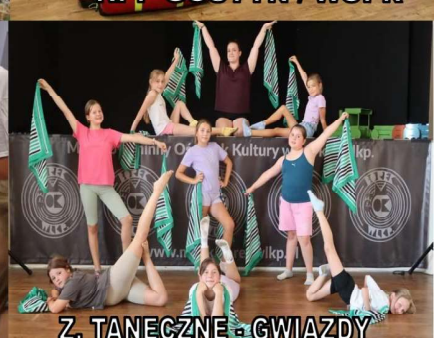
Z. TANECZNE - GWIAZDY