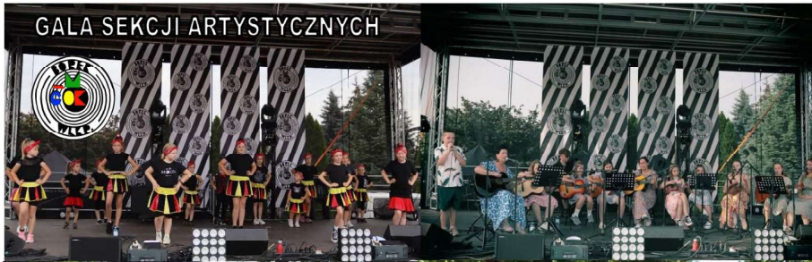
GALA SEKCJI ARTYSTYCZNYCH