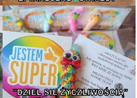
"DZIEL SIĘ ŻYCZLIWOŚCIĄ"