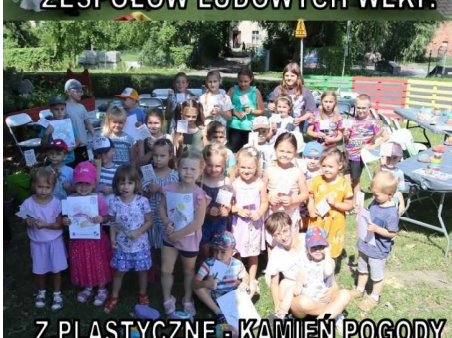
Z. PLASTYCZNE - KAMIEŃ POGODY