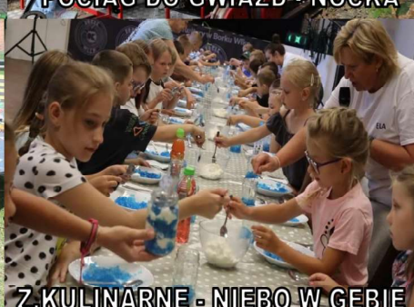
Z. KULINARNE - NIEBO W GĘBIE