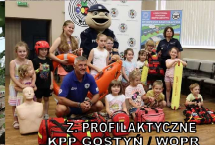
Z. PROFILAKTYCZNE KPP GOSTYN / WOPR