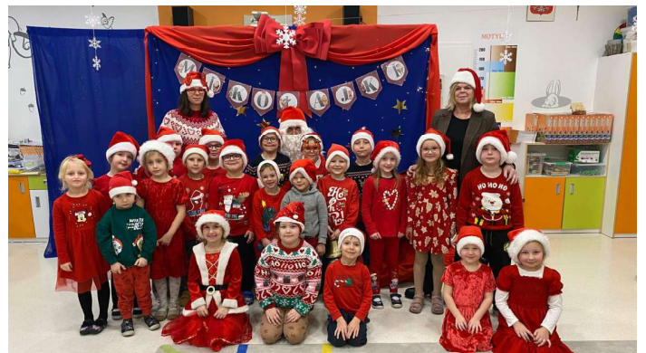
(Przedszkole Samorządowe „Pod Dębem” w Karolewie)

4 grudnia odwiedził nas bardzo miły i długo oczekiwany gość. Po śniadaniu, wszystkie grupy, spotkały się w dużej sali i z wielką radością powitały Świętego Mikołaja. Dzieci zaśpiewały piosenkę i zatańczyły. Spotkanie przebiegało w bardzo radosnej i przyjaznej atmosferze. Święty Mikołaj obdarował wszystkie przedszkolaki słodkościami oraz zabawkami. Niespodzianką dla wszystkich było przedstawienie teatralne pt. „Święta zebra”. W spektaklu wystąpili aktorzy z teatru Pompon. Na twarzach dzieci malowała się wielka radość i przejęcie, a także nadzieja na kolejne spotkanie.