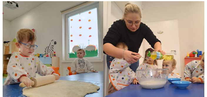
(Żłobek Publiczny w Karolewie)

Koliberki i Sówki poznały historię chleba, czyli cały proces jego powstawania. Wspólnie z opiekunkami przygotowały własny, ziołowy chlebek. Dzieci w naszym żłobku uwielbiają zajęcia kulinarne, ponieważ ćwiczą zdolności samoobsługowe i manipulacyjne, a także świetnie się razem bawią.