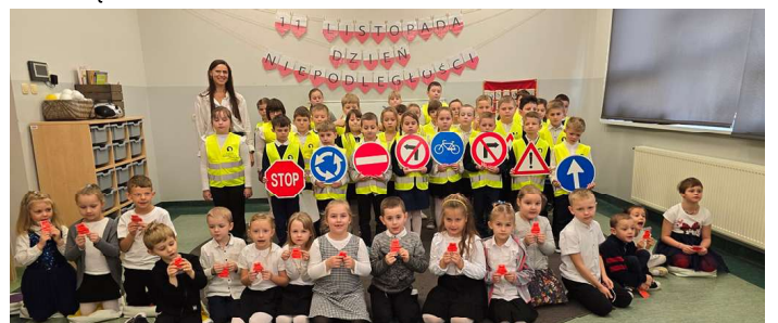
(ZSP w Zimnowodzie)

Na lekcjach techniki przeprowadzono cykl zajęć dotyczących zasad bezpiecznego poruszania się po drogach, uczniowie poznali znaczenie znaków drogowych, zasady przechodzenia przez jezdnię oraz rolę elementów.